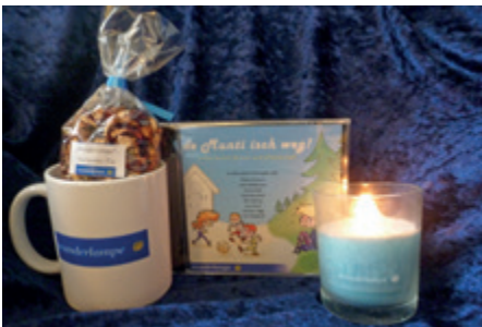
Tasse (CHF 10.–), Tee (2 Pack à CHF 5.–), Set Tasse & Tee (CHF 12.–), Hörspiel (CHF 15.–), Kerze (CHF 8.–).

Speziell für Weihnachten haben wir auch eine wunderschöne Karte entworfen für all diejenigen, welche ihre Weihnachtsgrüsse gerne noch per Post versenden oder ein Geschenk mit ein paar persönlichen Worten begleiten möchten. Auch hier kommt der Erlös vollumfänglich den wünschenden Kindern und Jugendlichen zu.