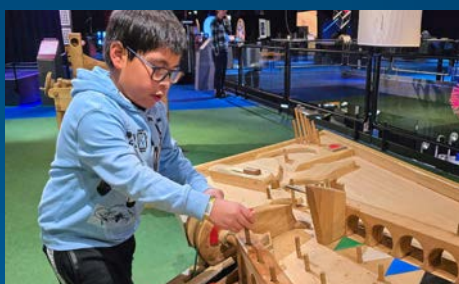
Mervic ist begeistert vom Technorama und seinen Phänomenen.